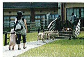
❖ 動物ふれあい広場