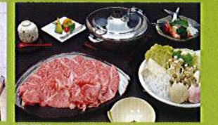
但馬牛しゃぶしゃぶ