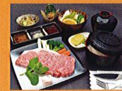
但馬牛ステーキセット(要予約)